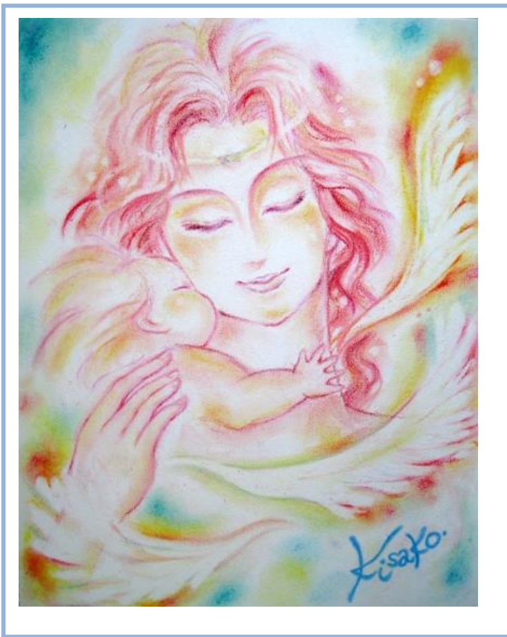
イラスト KISA 寺井規佐子 アメブロ 絵かき屋 KISA http://ameblo.jp/spacetera/